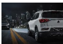
Allumage automatique des feux