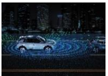
Régulateur de vitesse adaptatif intelligent (option BVA)