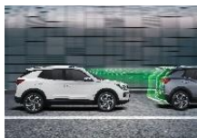
Système d'alerte de démarrage du véhicule en amont