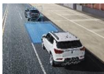
Alerte de distance de sécurité