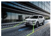
Système d'alerte de franchissement de ligne